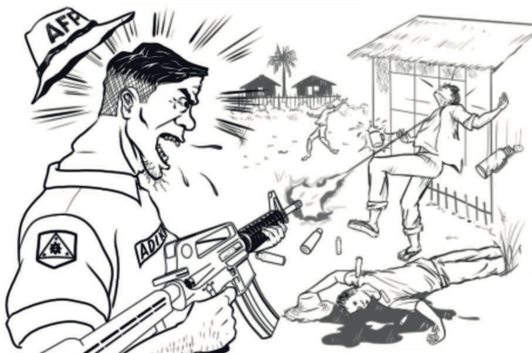
"62nd IB..." sundan sa pahina 6